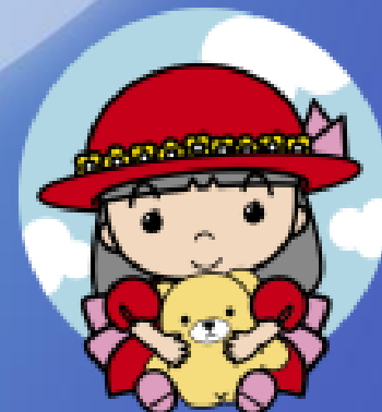
てんかん運動マスコットキャラクター あかりちゃん